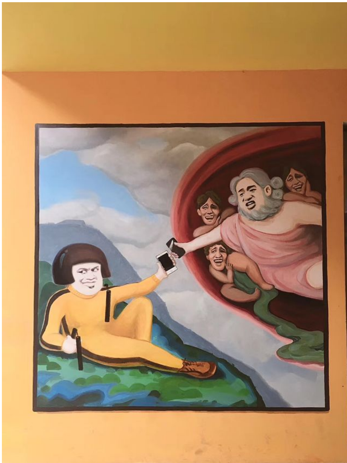
它是恶搞了国外一幅名画《创造亚当》。